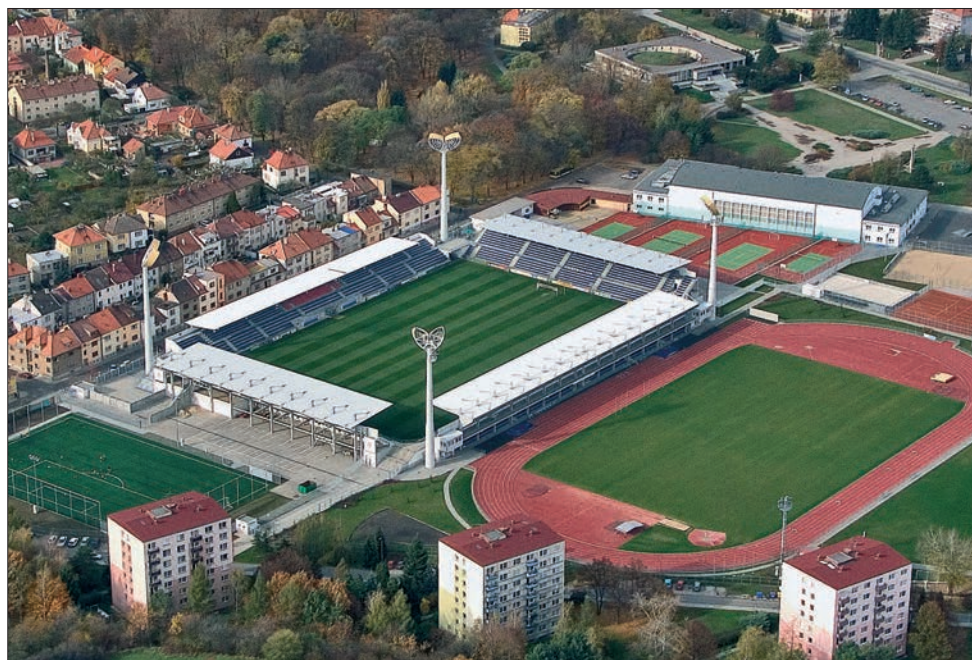
Městský sportovní areál