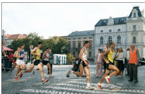
v rok 2006